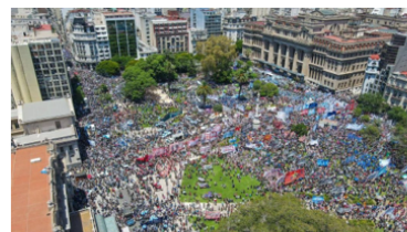
CTERA 與公部門工會 CTA 於國會前示威抗爭，反對政府 DNU「必要與緊急法令」。

阿根廷 2023 年 11 月總統大選，有「阿根廷川普」之稱的經濟學家、國會議員哈維爾米萊 (Javier Milei)，以近 56% 得票率擊敗左傾執政黨與最大在野黨，成為第三勢力當選阿根廷總統。這位極右翼政治素人、狂人與名嘴，以「砍掉重練」式的激進言論與競選宣傳「自由萬歲! 政治菁英滾出去! 廢除政治種姓制度! 經濟休克療法!」獲得廣大年輕人的支持，包括作罷央行、拿電銀票削減政府社福開支、全面以美元取代比索 (貨幣美元化)。2023 年阿根廷的通膨高達 211%、40% 人民生活在貧困中，米萊選前表示要凍結國際兩大貿易夥伴——中國、巴西的經貿關係，表示不與共產黨打交道、暗指北京政府是剝奪，當選後馬上髮火聲，強調中阿兩國經濟互補性強、希望加快兩國貨幣互換。米萊支持極權權、反墮胎，是民族主義者，媒體評其「極具侵略性與戲劇性風格」受到選民歡迎，卻為該國經濟危機更添不確定性。