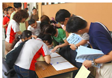
會員代表們領取選票