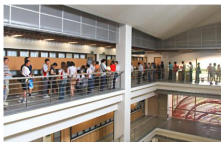
會員代表排隊圈選選票