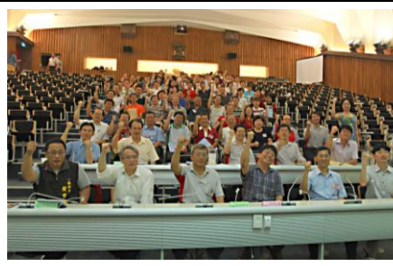
大會圓滿成功！團結~讚啦！