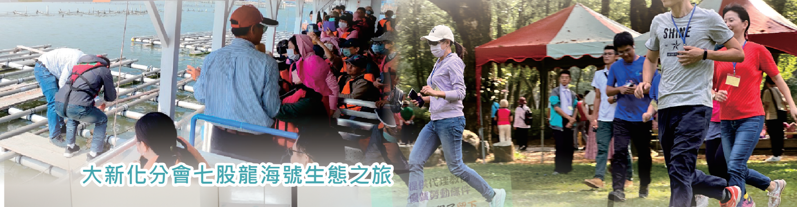
大新化分會七股龍海號生態之旅