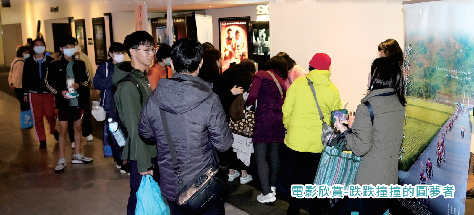
電影欣賞-跌跌撞撞的圓夢者