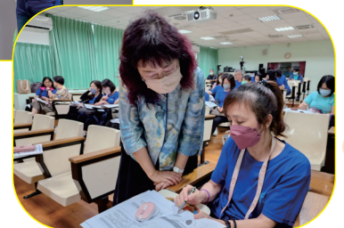
▲學共研習活動照片