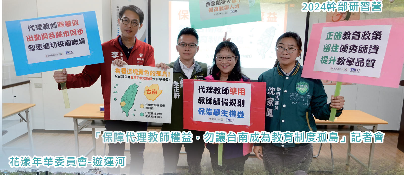
「保障代理教師權益。勿讓台南成為教育制度孤島」記者會