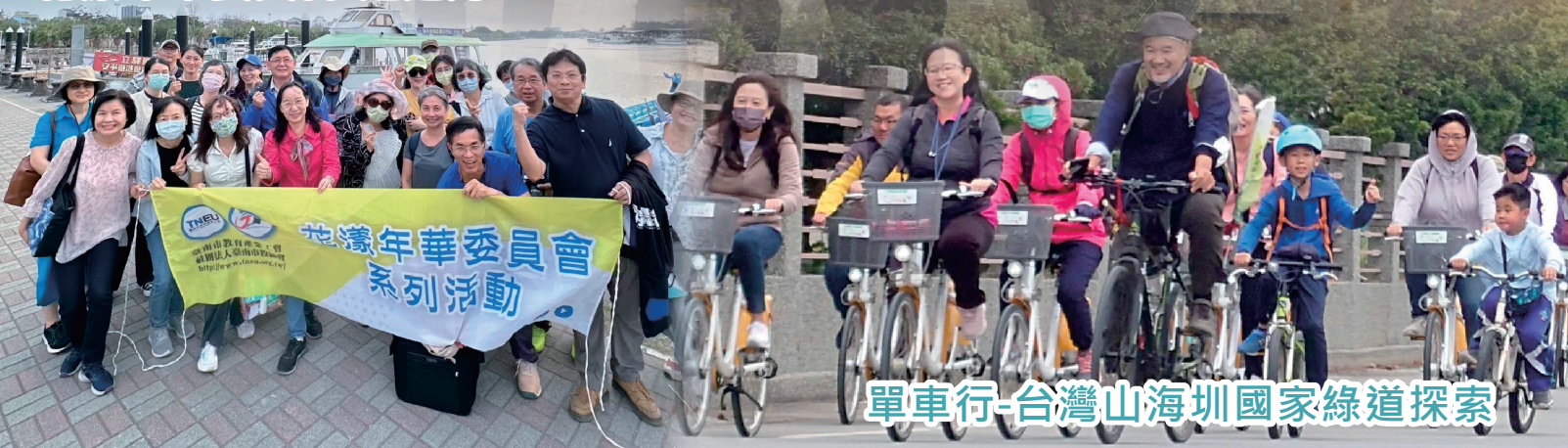
單車行-台灣山海圳國家綠道探索