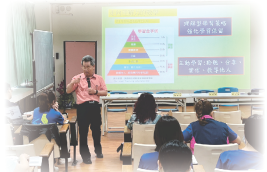
▲▼ 學習共同體融入108課綱的理解力教學