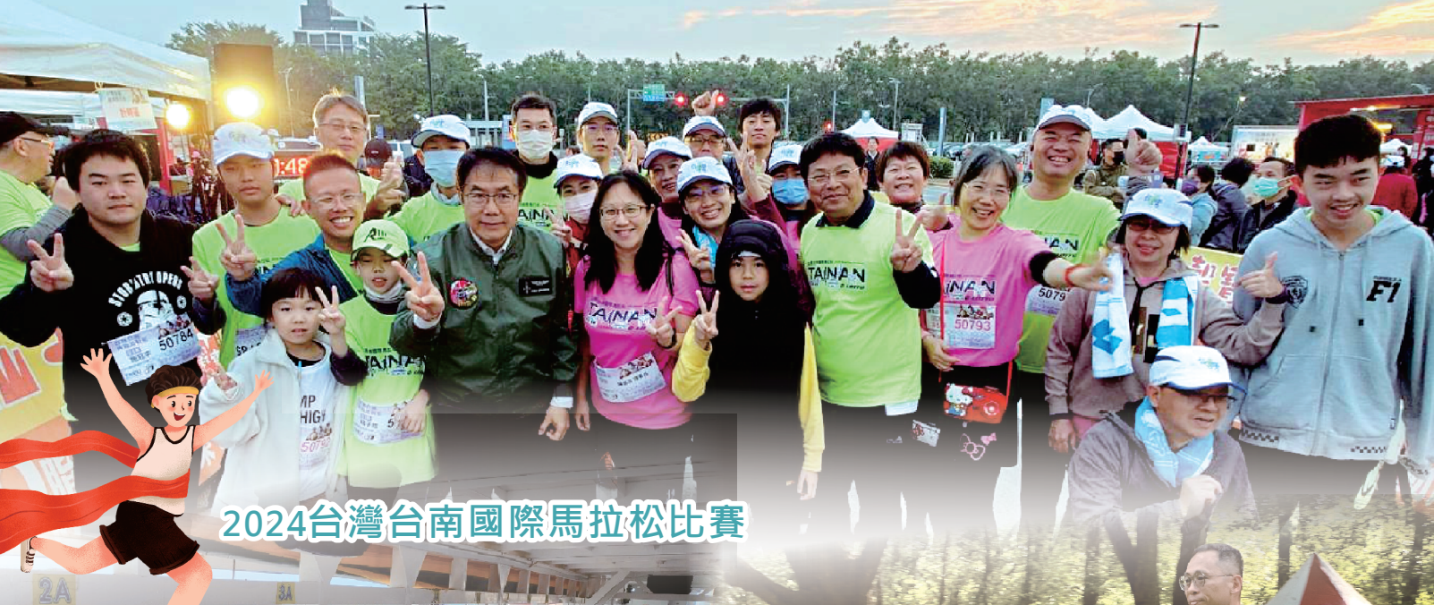
2024台灣台南國際馬拉松比賽