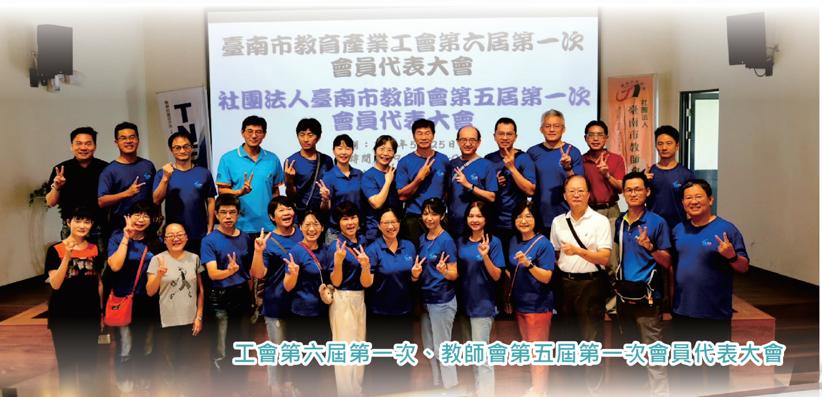
工會第六屆第一次、教師會第五屆第一次會員代表大會