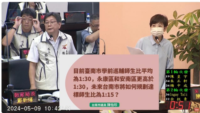
20240509 (上午) 民政教育部門業務報告及質詢-教育局、人學處、秘書處

持續關心此議題，113 年 5 月 9 日於臺南市議會提出質詢，怡珍議員提到教育部今年 5 月 3 日正式修法通過，全國統一規範，學前教育階段巡輔班師生比為 1:15。詢問降師生比期程和今年是否考教甄。鄭局長回應 113 學年將增加 23 位學前特教巡輔正式教師。