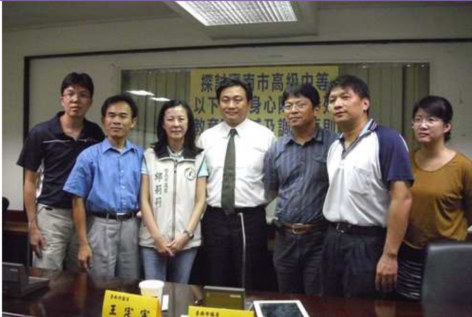
本會參與王定宇議員召開「臺南市高級中等以下學校身心障礙特殊教育班增減及調整原則」座談會 101 年 8 月 14 日於市議會

未來面臨少子化的衝擊及特殊教育新課程大綱實施的諸多問題，勢必需要投入更多專業人力，「需求評估、鑑定安置及資源到位」是我們的訴求，期盼本市特教教師能夠結合工會共同投入參與，希望建構本市良好的特殊教育環境，以保障學生的受教權。