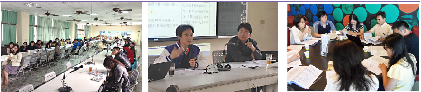
特殊教育委員會會議