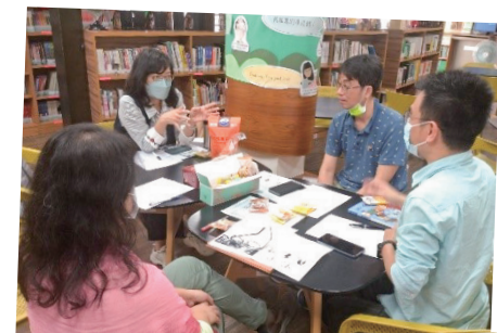
照片說明：永中基地班備課