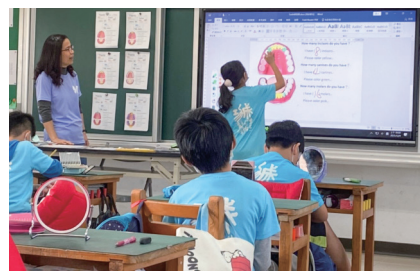
照片說明： 公開觀課～英語融入健康課程