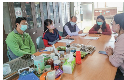
照片說明： 公開觀課～英語融入生活課程