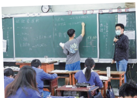
照片說明：永中302觀課