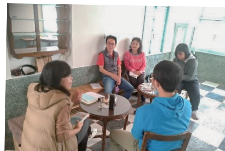
照片說明：假日議課兼讀書會