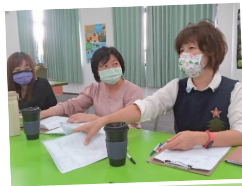
照片說明：議課時夥伴提出見聞