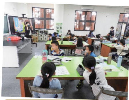
照片說明：閩南語觀課現場