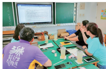
照片說明： 共備時間～討論課程內容