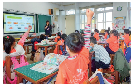
照片說明： 公開觀課～英語融入健康課程