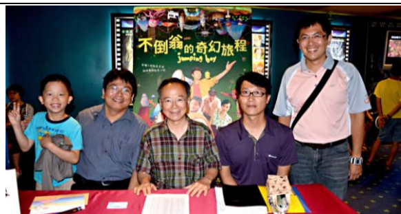
教育局鄭邦鎮局長蒞臨指導 101.5.13