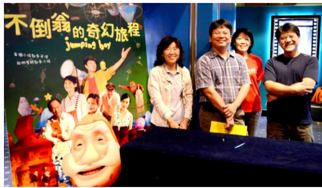
幹部們協助活動事宜 101.5.12