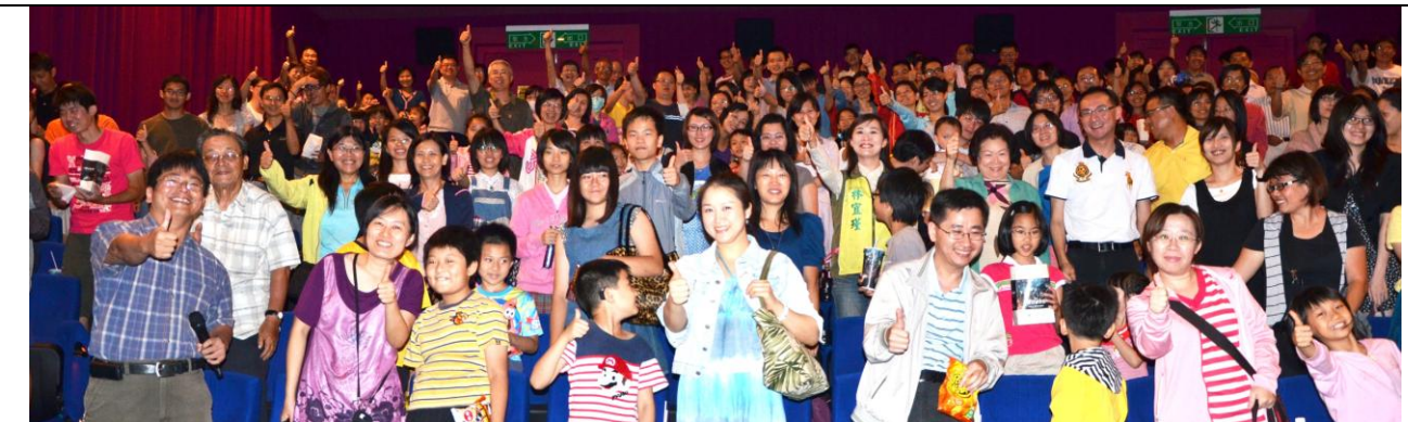
歡慶母親節「以正向力量挺台南在地國片」活動計畫