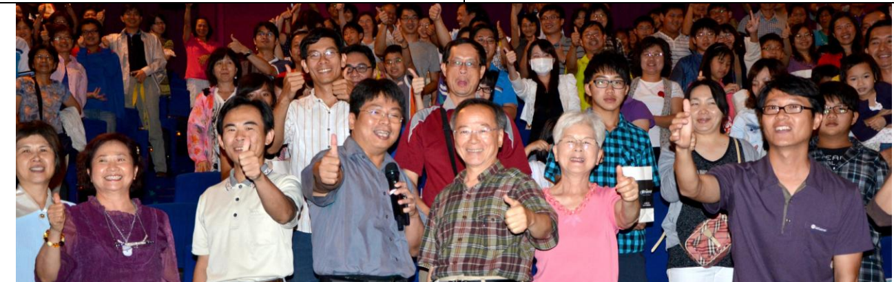
分會活動首例圓滿成功，全體一致「讚」啦！ 101.5.13