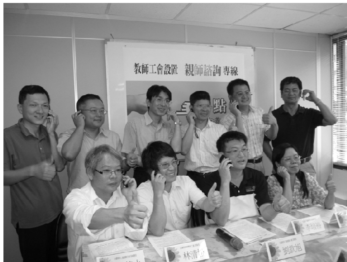
全國教師工會總聯合會 The National Federation of Teachers Unions (NFTU)