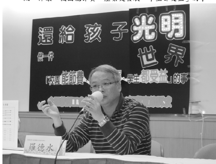
全國教師工會總聯合會 The National Federation of Teachers Unions (NFTU) 全國教師工會總聯合會 The National Federation of Teachers Unions (NFTU)

2012年4月2日「還給孩子『光明』世界」記者會~ 做一件讓「校園能節費、產業更發展、學生都受益」的事