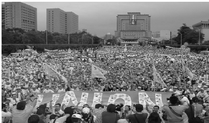
全國教師工會總聯合會 The National Federation of Teachers Unions (NFTU)