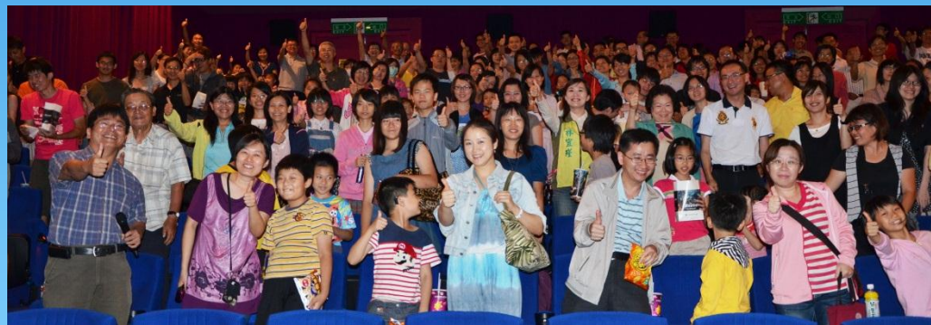
歡慶母親節「以正向力量挺台南在地國片」 —《不倒翁的奇幻旅程》從台南啟程讓夢想上路