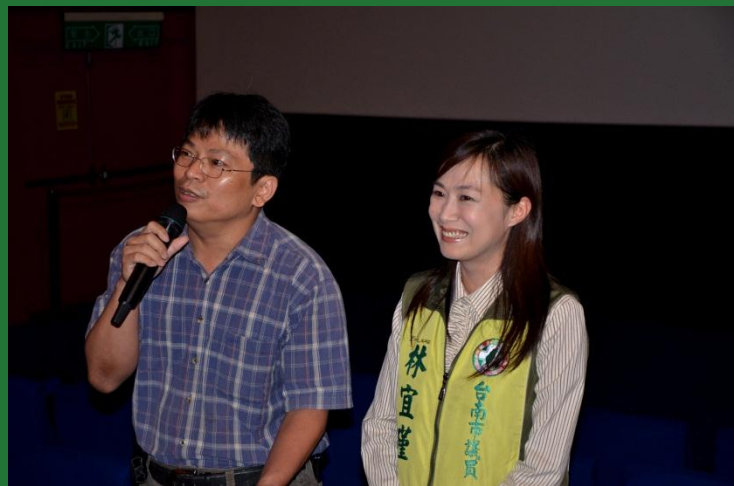
林宜瑾議員長期支持工會政策與活動