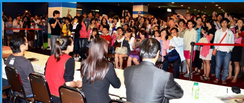
「教師歡度928、百元助學挺國片」活動、捐贈原住民學童獎助學金