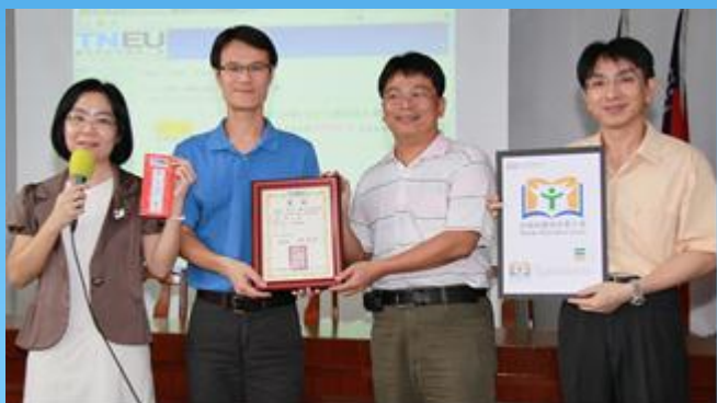
工會識別圖案 (LOGO) 設計比賽頒獎