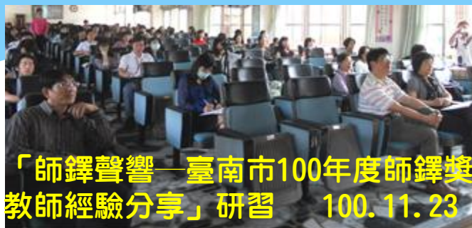
「師鐸聲響—臺南市100年度師鐸獎 教師經驗分享」研習 100.11.23